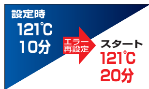
●設定不備はエラー音で告知